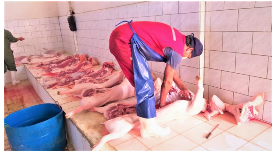
4. Proceso de lavado y oreo de ganado porcino