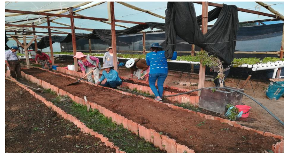
3. (Capacitación en almácigo de semillas de Hortalizas)