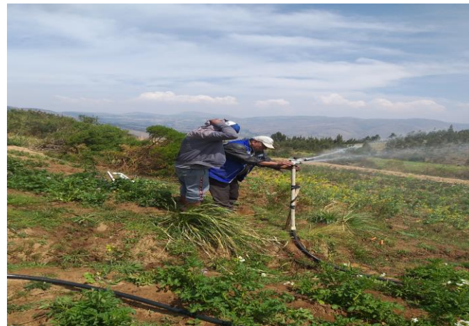
2. (Sistema de Riego por aspersion en distritos rurales)