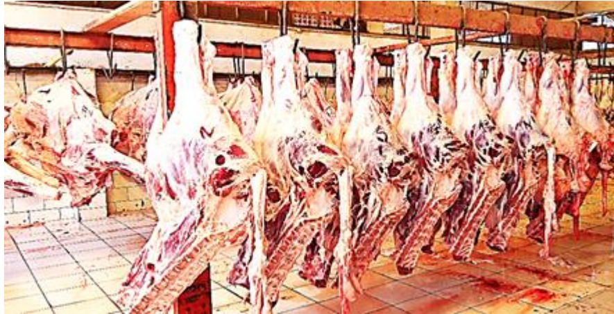
1. Proceso de oreo de carne bovina