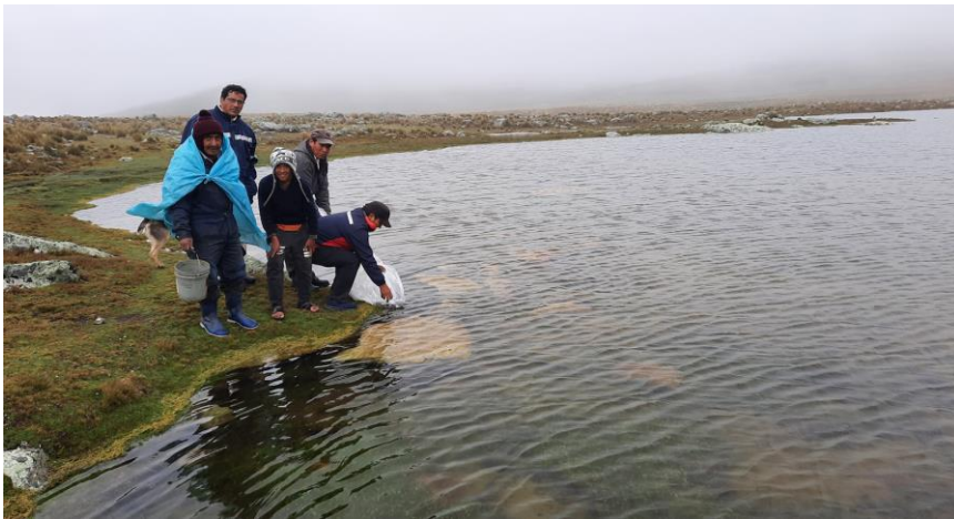
3. (Cultivo de Alevines de trucha en lagunas comunales del Municipio)