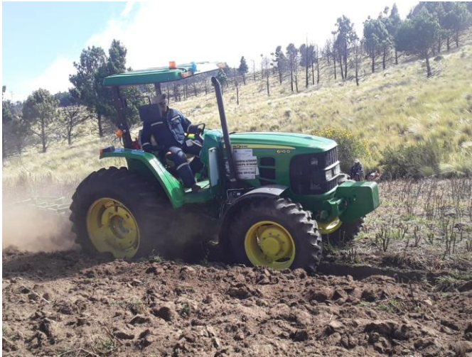
1. (Trabajo de arado con disco Distrito Rural Ucuchi)