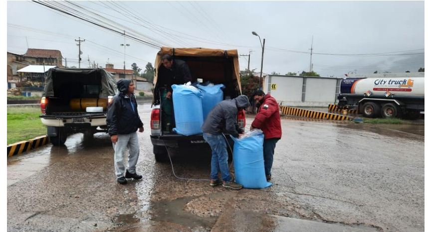
2.(Transporte de Alevines, en condiciones adecuadas)