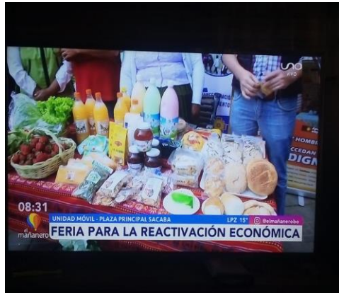
3. (Promoción y difusión de los emprendimientos en los medios de comunicación a nivel departamental.