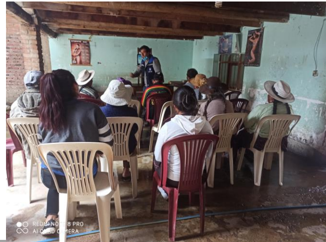
4. (Taller de capacitación en el Distrito Rural Ucuchi)