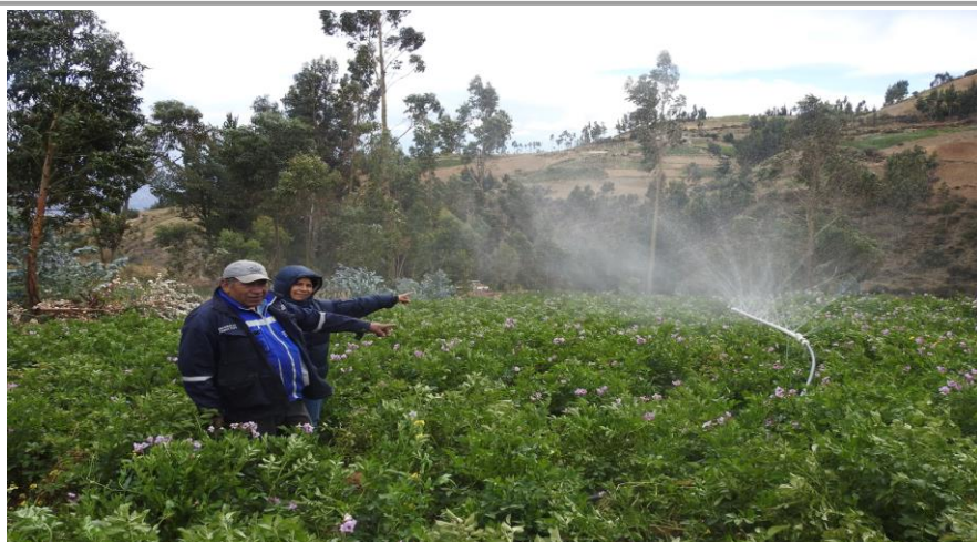
3. (Cultivo de papa implementado con riego tecnificado)