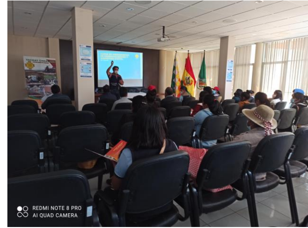
2. (Taller de capacitación de los emprendimientos en ambientes del Municipio)