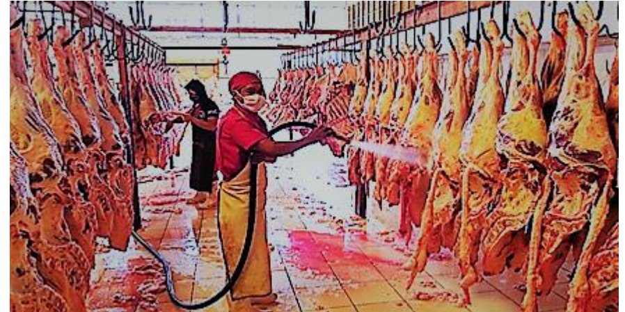
2. Área de lavado de carne bovina