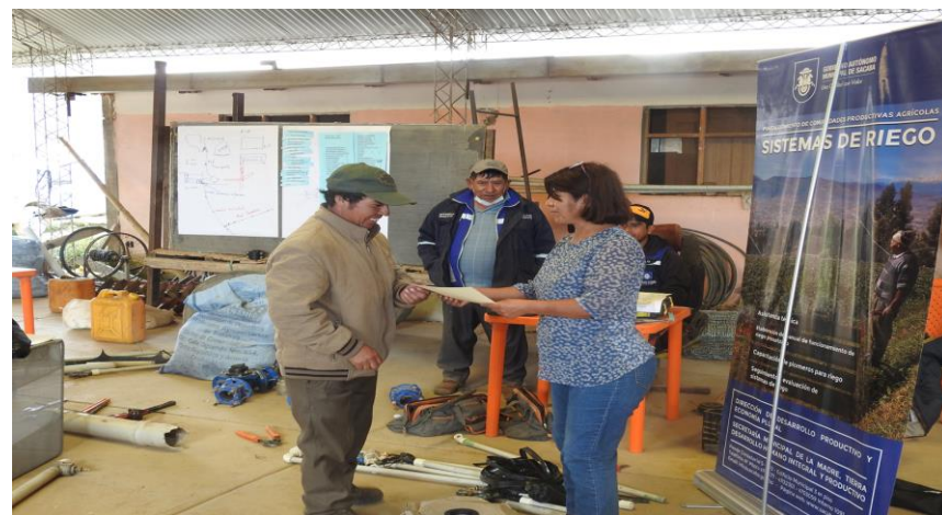
4. (Entrega de Certificado a los participantes del curso)