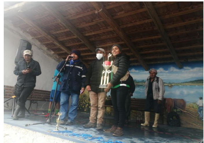
4. ENTREGA DE PREMIOS