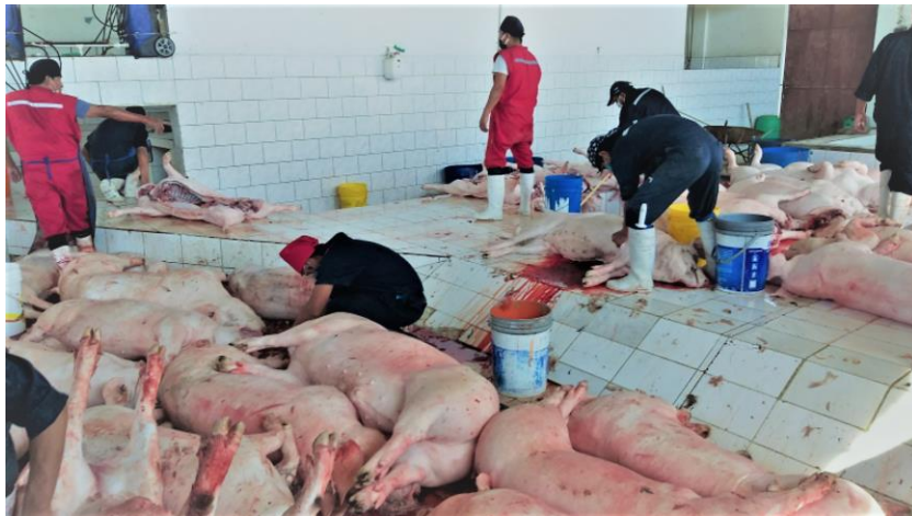
3. Evisceración de ganado porcino