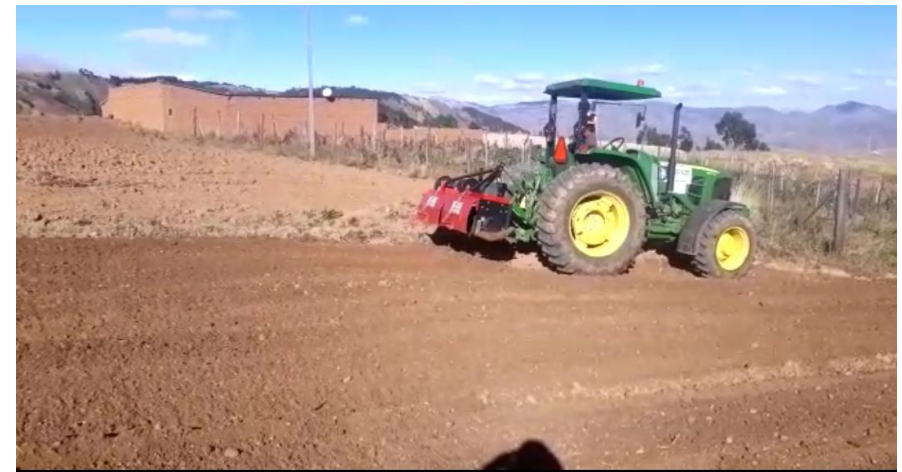
4. (Trabajo de arado con Rotabator Distrito 5 Sapanani)