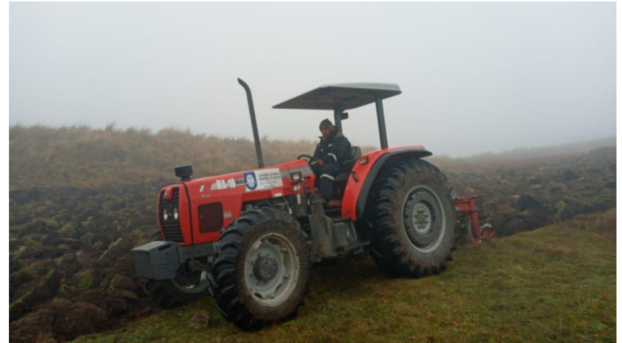
2. (Trabajo de Arado con disco Distrito Rural Palca)