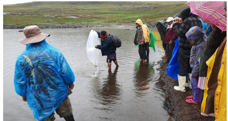
4. (Cultivo de alevines en presencia de beneficiarios)