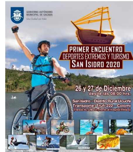
2. ENCUENTRO DE DEPORTES EXTREMOS