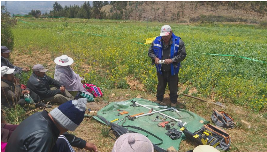
1. (Taller de fortalecimiento a la familias productoras, en sistemas de Riego)