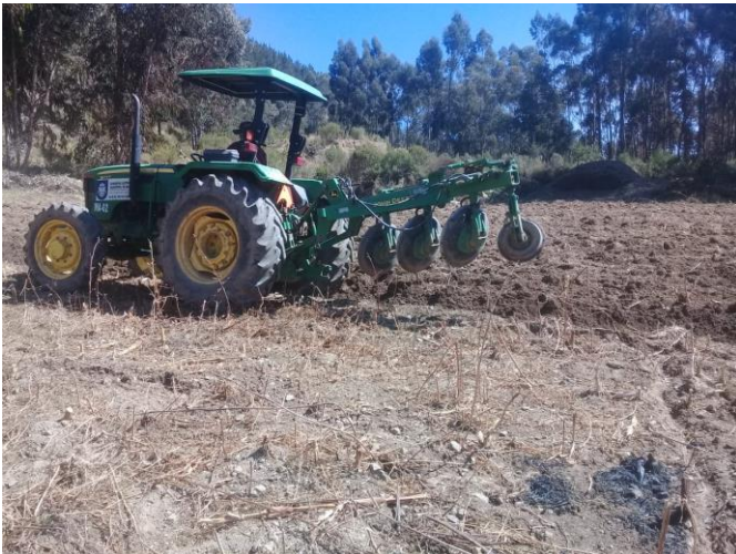
3. (Trabajo de arado con disco Distrito Rural Aguirre)