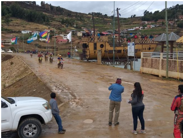
3. CARRERA DE MOTOCROSS