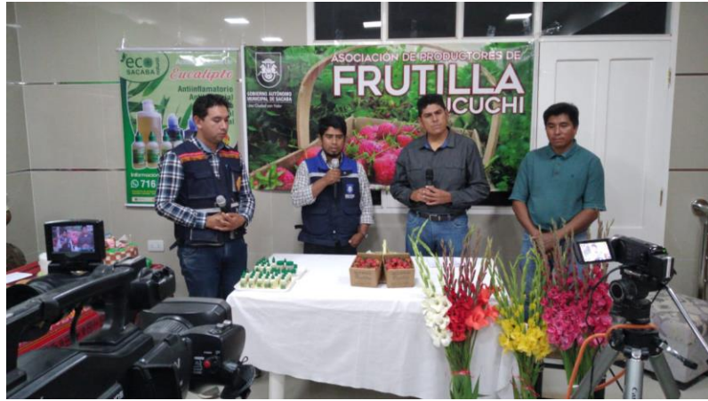
1. ( Promoción y difusión de los emprendimientos en medios de comunicación a nivel local)