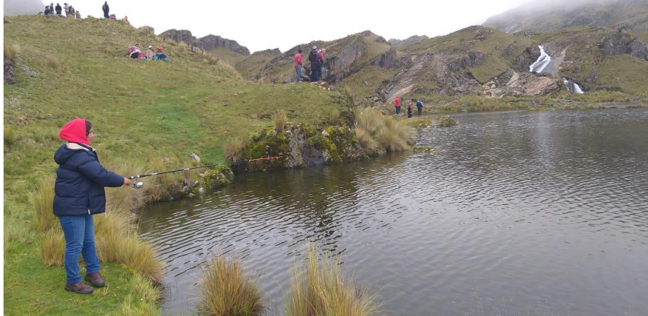
1. PESCA DEPORTIVA EN PALCA